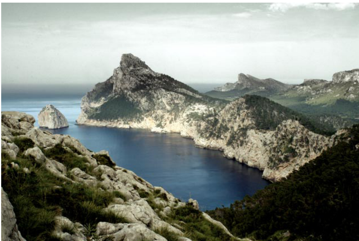
Formentor (Mallorca).

POR CARLESDOMENEC el 24 SEPTIEMBRE 2015 · ( 0 )